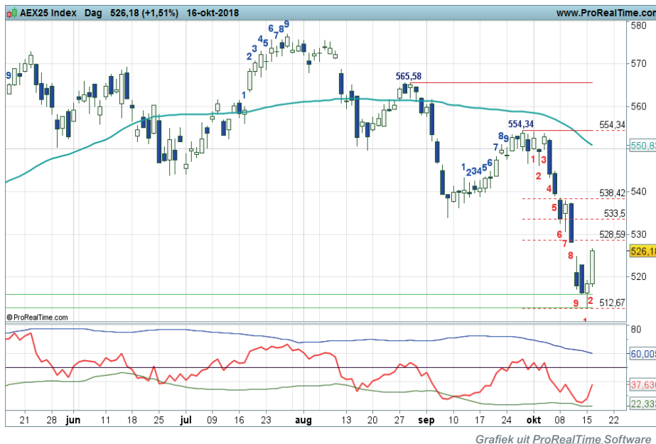
Grafiek uit ProRealTime Software

Conditie: mogelijk van Down naar Support. Coaching aanbeveling: Rebound posities richting 528 tot 538.