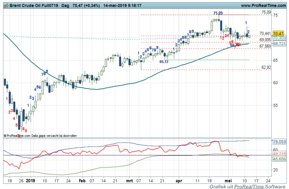
Daggrafiek BrentOil

Conditie: Up. Coaching: koopposities kunnen worden gehandhaafd. Onder 68 gaat een negatieve overgangsfase van start.