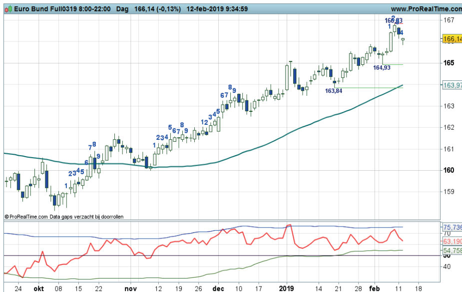
Grafiek uit ProRealTime Software

Coaching: Trendbeleggers kunnen posities aanhouden. Bij signalen van topvorming wellicht wat winsten veilig stellen. Na correcties liggen er nieuwe koopkansen.